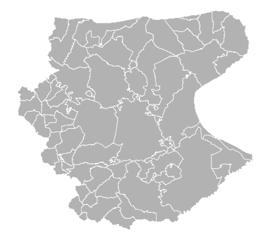
Tavola S2 Sistema insediativo e mobilità 1:150 000