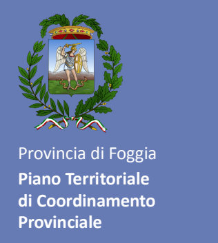
Tavola A1 Tutela dell'integrità fisica