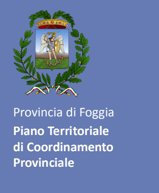
Tavola A1 Tutela dell'integrità fisica